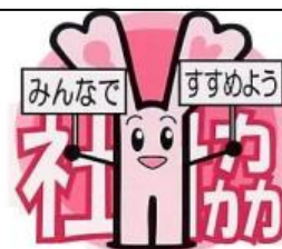
横須賀市社会福祉協議会 マスコットキャラクター “フッピー”