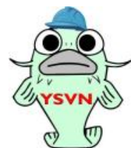
横須賀災害ボランティアネットワーク マスコットキャラクター “スカナマズ”

ファックス申込書 (自作でもかまいません) (申し込みは電話・電子メールでもかまいません) 避難所宿泊体験