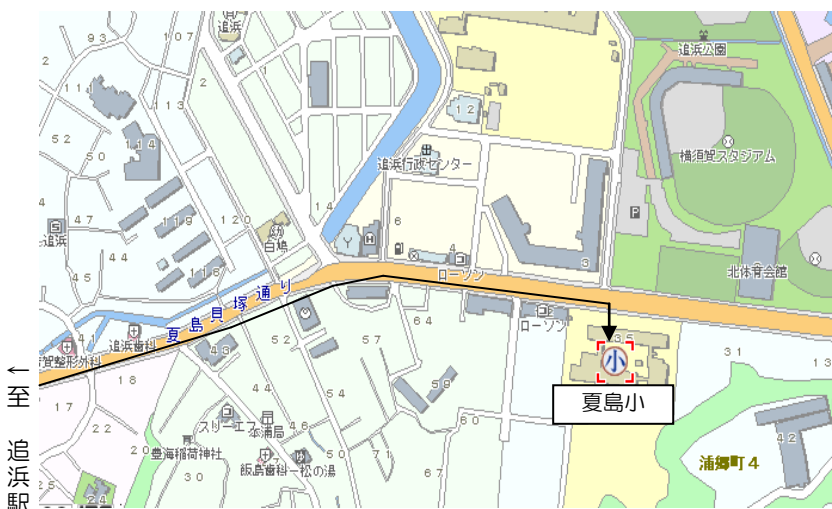
夏島小学校の付近の地図・写真