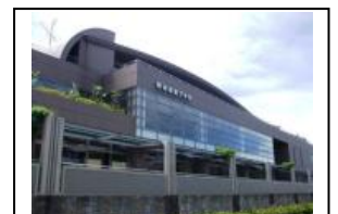
武山コミュニティセンター